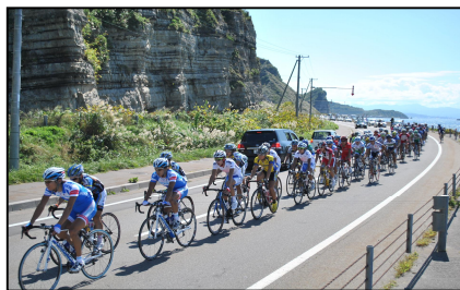
第1ステージ 寿都町