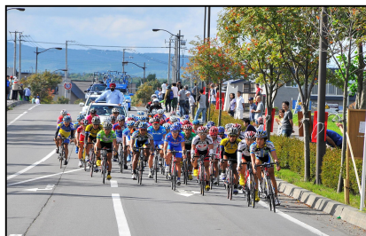
第3ステージ 壮瞥町