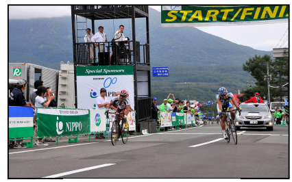
第2ステージ 倶知安町