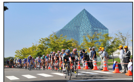
第4ステージ 札幌市モエレ沼公園